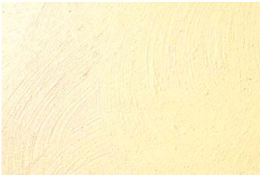
Nr. 307 (finkornet), tonet med AURO Fuldtone- & Tonermaling nr. 330-10 (okker-gul), påstrøget med fladestryger (halvcirkler i alle retninger, fejende bevægelser). Farveafvigelser pga. trykversion mulige!